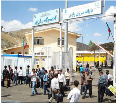
نقش شوراهادر مدیریت نیروهای کار بومے وغیر بومے

حضور نیروهای کار غیر ایرانی به خصوص در شهرهای مرزی، گاهی برای مردم منطقه مشکلاتی را ایجاد می کند. یکی از این مشکلات، ایجاد تضاد فرهنگی است. چگونگی و نحوه حضور این نیروها باید کنترل شده باشد تا از یک سو به بافت فرهنگی و اجتماعی منطقه لطمه نزنند و از سوی دیگر موجب سو استفاده از نیروهای کار غیر ایرانی نشود. عدم توجه به این مساله در بلند مدت منجر به تغییر بافت فرهنگی و اجتماعی شده و مشکلاتی را برای شهر میزبان به وجود می آورد. یکی از وظایف شوراهای شهر و روستا این است علاوه بر توجه به مزایای اقتصادی حضور این نیروها، مراقب حفظ هنجارها و ارزش های بومی منطقه نیز باشند. پس در انتخاب اعضای شورای شهر این موضوع را در نظر بگیرید و از کاندیدها بخواهید تا برای این گونه مشکلات شهری هم برنامه و راهکار ارائه دهند.