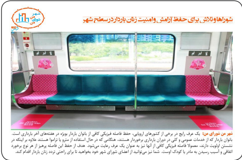
شهر من شورای من: یک عرف رایج در برخی از کشورهای اروپایی، حفظ فاصله فیزیکی کافی از بانوان باردار بویژه در هفته‌های آخر بارداری است. بانوان باردار که از خدمات عمومی و کلی در دوران بارداری برخوردار هستند، هنگامی که در حال استفاده از مترو یا تراموا هستند علاوه بر اینکه در نشستن اولویت دارند، معمولاً فاصله فیزیکی کافی از آنها نیز به عنوان یک عرف رعایت می‌شود. هدف از حفظ این فاصله پرهیز از هر نوع برخورد اتفاقی و آسیب رسیدن به مادر یا کودک اوست. شما نیز می‌توانید از اعضای شورای شهر خود بخواهید تا برای راحتی تردد زنان باردار اقدام کند.

یک عرف رایج در برخی از کشورهای اروپایی، حفظ فاصله فیزیکی کافی از بانوان باردار به‌ویژه در هفته‌های آخر بارداری است. بانوان باردار که از خدمات عمومی و کلی در دوران بارداری برخوردار هستند، هنگامی که در حال استفاده از مترو یا تراموا هستند علاوه بر اینکه در نشستن اولویت دارند، معمولاً فاصله فیزیکی کافی از آنها نیز به عنوان یک عرف رعایت می‌شود. هدف از حفظ این فاصله پرهیز از هر نوع برخورد اتفاقی و آسیب رسیدن به مادر یا کودک اوست. شما نیز می‌توانید از اعضای شورای شهر خود بخواهید تا برای راحتی تردد زنان باردار اقدام کند.